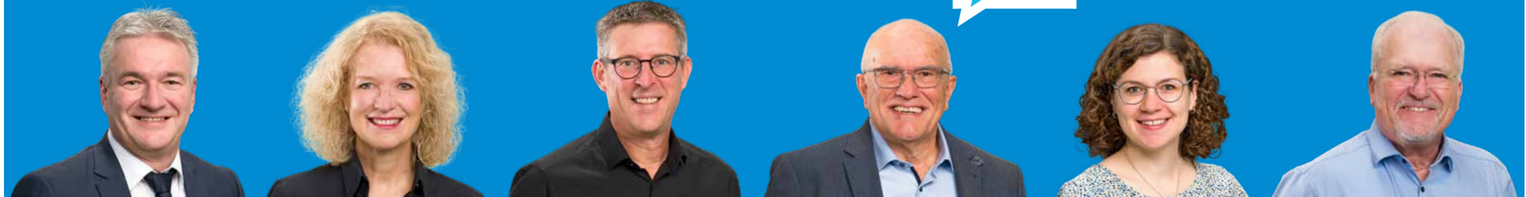
Bernd Dürr Dipl. Verwaltungswirt (FH), Bürgermeister, Kreisrat, 55, Bondorf, verheiratet, 2 Kinder

Schnelle und verlässliche Mobilität im ÖPNV und im Individualverkehr zum Erhalt der Arbeitsplätze in der Region. Bezahlbarer Wohnraum und regenerative Energie für unsere Zukunft.